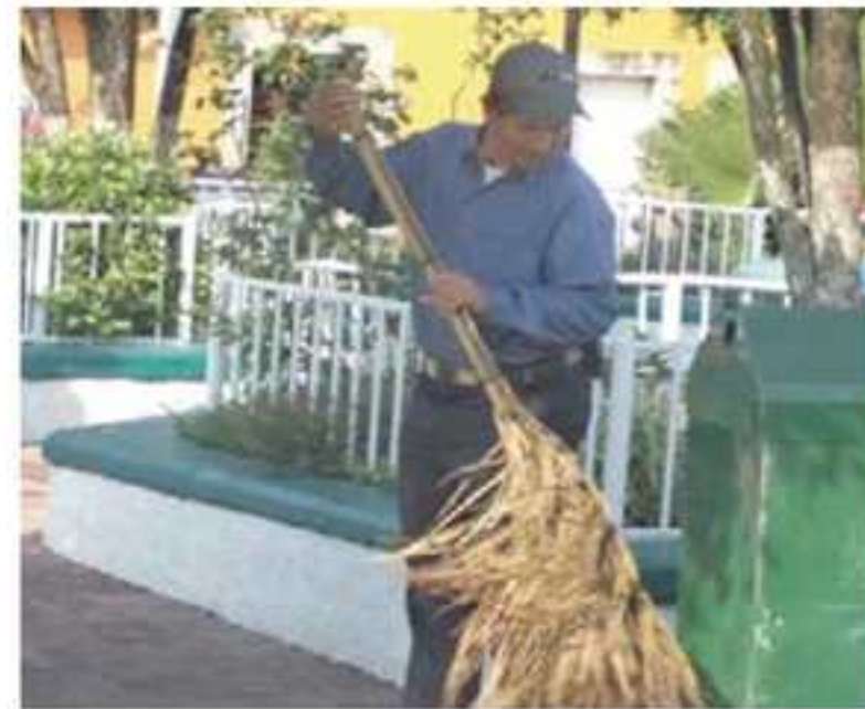
Limpieza del Centro Histórico