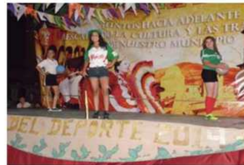
Certamen de Belleza Reina del Deporte