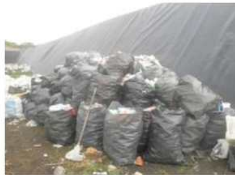
Separación de Basura en Relleno Sanitario