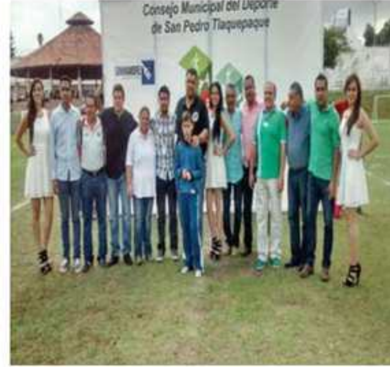
Torneo Relampagos en San Pedro Tlaquepaque