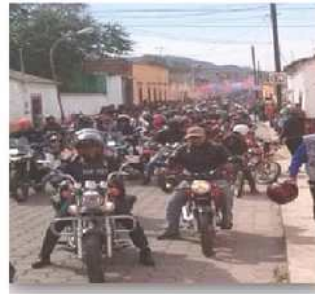
Escuadrón Acrobático de La Secretaría De Vialidad Del Estado De Jalisco.