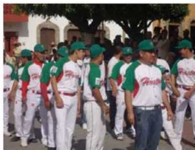
Reyna del deporte y deportistas haciendo presencia en el desfile.