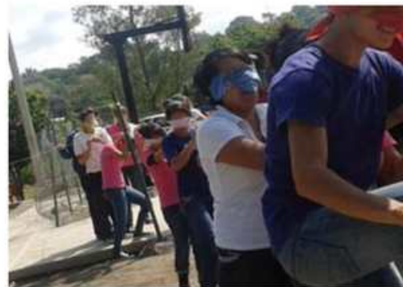
La línea de la vida