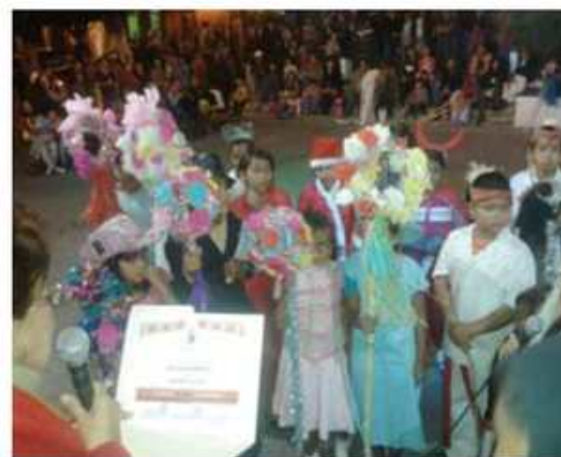
Villancicos de los jóvenes