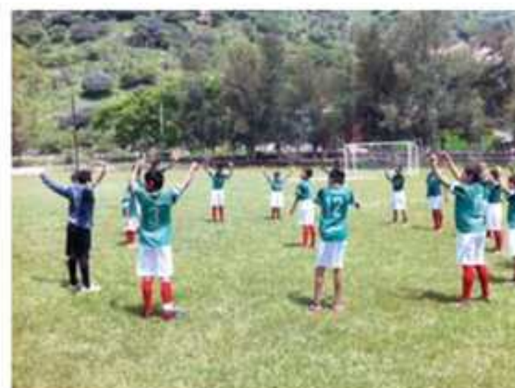
Campeones de Liga Infantil Municipal de Magdalena, Jalisco; temporada 2