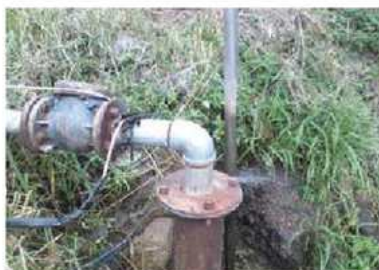
1. Fotografía de la Bomba de Agua del arroyo llamado "El Capulín"

También en este mes de agosto del 2013 se descompuso la bomba de agua del arroyo del capulín que abastece de agua a la Cabecera Municipal misma que es de 40 caballos de fuerza y la cual no tuvo arreglo por lo que se procedió a comprar una nueva misma que tuvo un costo de $56,000.00 (CINCUENTA Y SEIS MIL PESOS 00/100 M.N)