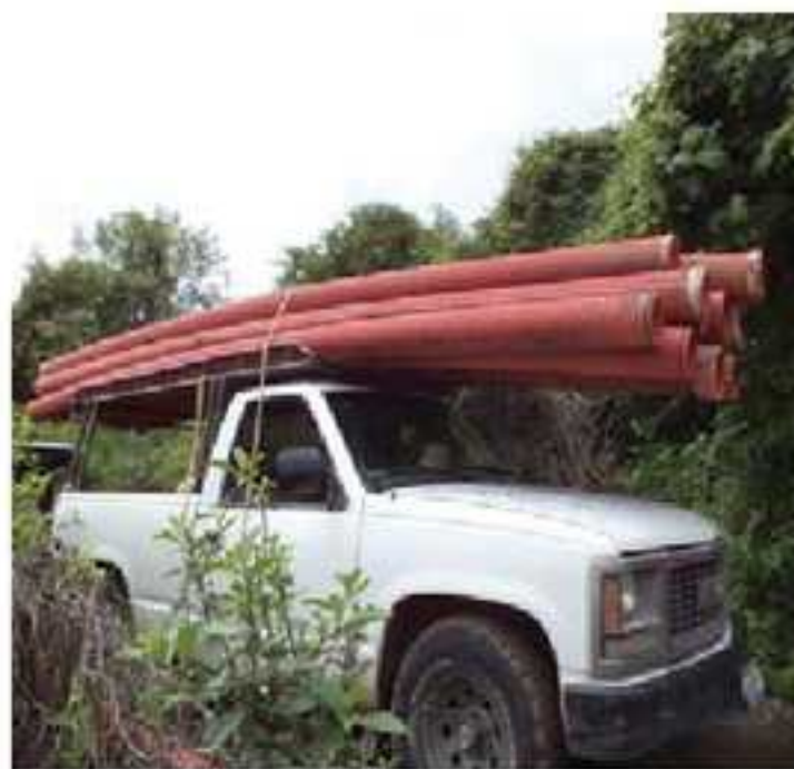
2. Tuvo galvanizado

En la localidad de Santo Tomás se les apoyó con ocho tubos galvanizados de 2" pulgadas equivalente a 48 metros para realizar conexiones de tomas de agua.