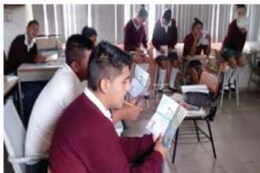
Alumnos de la Telesecundaria Primitivo Ávila en la Localidad del Tequesquite.

Durante este mes, con la finalidad de darle seguimiento al programa Prevención Juvenil, se iniciaron pláticas con las madres de familia de los alumnos de la Escuela Telesecundaria Primitivo Ávila Leal, de la localidad de El Tequesquite, donde participaron doce mujeres de entre veinticinco y cuarenta y cinco años de edad, participando en el curso-taller “Madres en Prevención”.