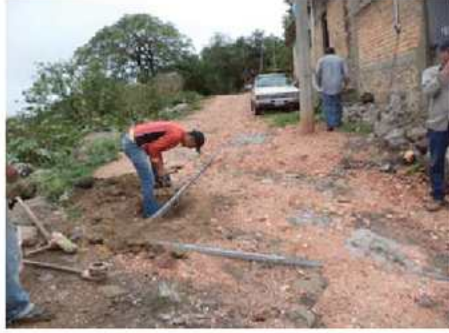
3. Reparación de tubería de agua potable.

Dentro de las acciones implementadas por ésta Administración Municipal está la de mejorar la calidad de los servicios públicos por lo que en cabecera municipal por la calle corregidora se cambiaron 84 metros de drenaje en mal estado para lo que se necesitaron 14 tubos de 8" pulgadas, también se amplió la red de agua potable por la calle Privada Javier Mina para esto se necesito 70 metros de tubo PVC de 2 1/2" (Dos pulgadas y media), así como la maquinaria necesaria.