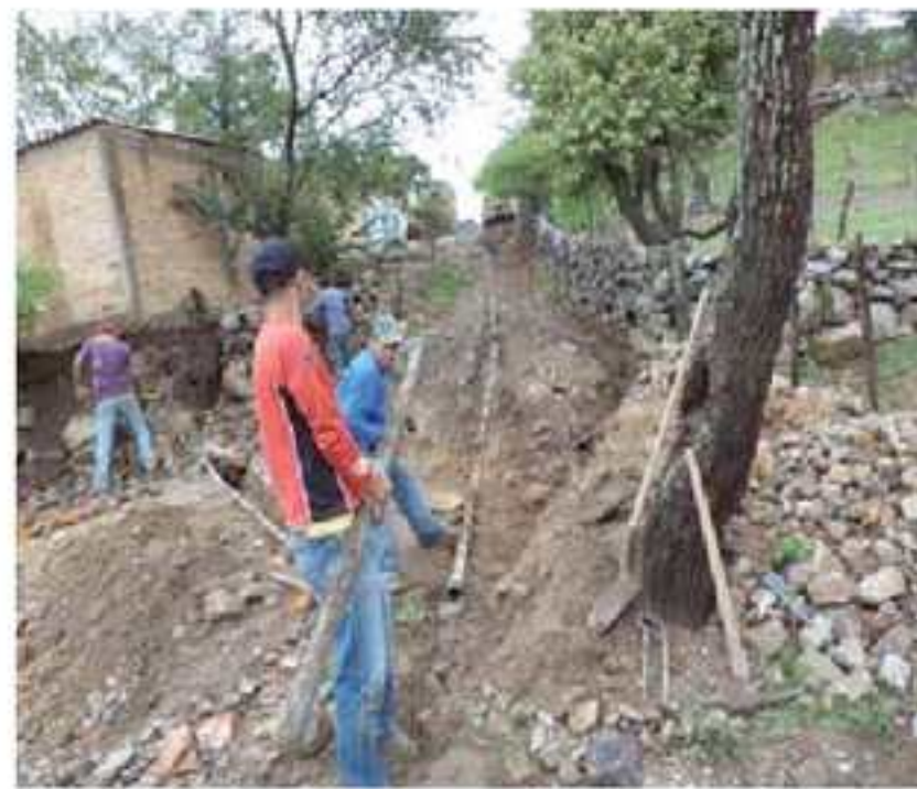
4. Instalación de tubería de red de agua potable.

En el Municipio de Hostotipaquillo se continua trabajando para el bienestar de todos por eso se siguen instalando tomas de agua potable, drenaje, reparación de tuberías rotas entre otros también se le ha dado el mantenimiento a los pozos y a los tanque de agua potable.