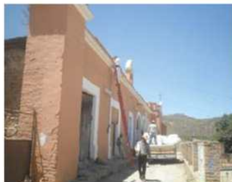
Instalación de lámpara en la localidad de La Labor de Guadalupe.