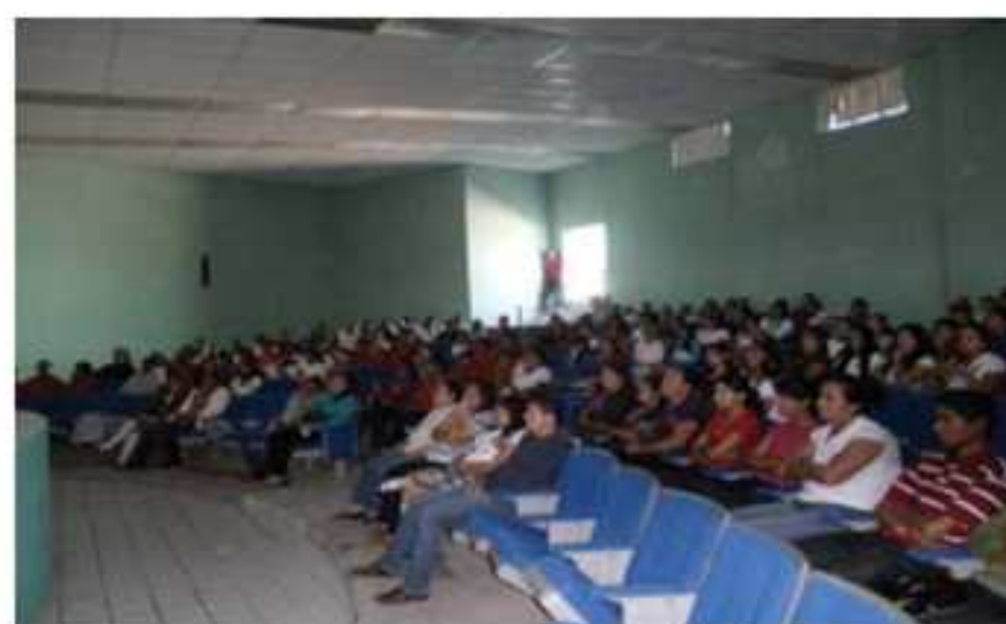
Entrega de constancias, conferencia alumnos y padres de familia.

En éste segundo periodo seguimos trabajando en la Escuela de Deportes Derechos y Valores, en la cual tenemos en un equipo de futbol de infantil en los que encuentran niños entre las edades de 6 a 12 años el cual logró ganar un campeonato en la Liga de Magdalena, Jalisco con paso firme sin perder un solo partido. A través de la escuela de deportes logramos reducir el ocio en Niños menores de 12 años, inculcando disciplina, valores y derechos.